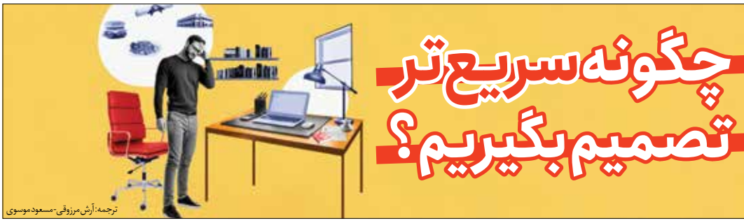
ترجمه: آرش مرزوفی - مسعود موسوی